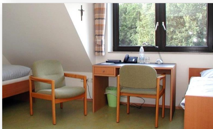
Doppelzimmer mit Dusche und WC