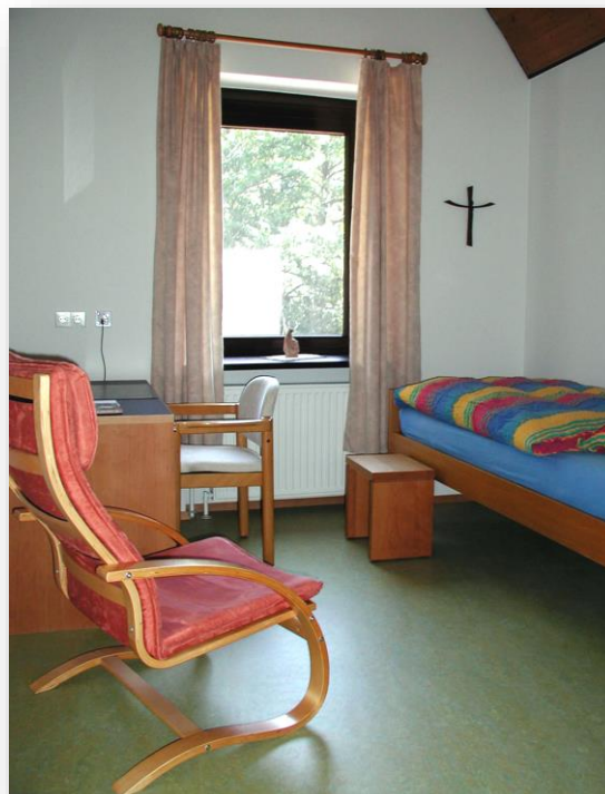
Einzelzimmer mit Dusche und WC