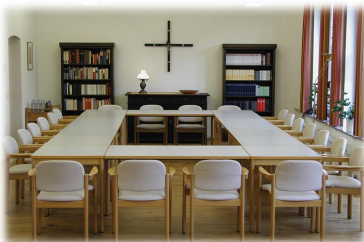
Tagungsraum + Fernsehraum